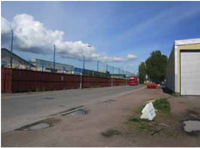
Kollage från IL Recycling: En av de stora hallarna med sorterad papp och kartong; Balar med sorterad och pressad plast; Transport sker med tryck och små traktorer inom anläggningen; Ett enkelt träplank skärmar av återbruksverksamheten mot Järnmalmsgatan.

siktet inställt på en återvinningsmarknad i förändring mot en cirkulär ekonomi. 38) Det gäller att vara med i sin tid. Det framgick tydligt i de intervjuer jag genomfört med platschefen och transportchefen vid IL Recycling i Ringön som båda flera gånger återkom till den starka konkurrensen inom återvinningsmarknaden. 39)